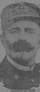
DUQUE DE GENOVA

El Príncipe Tomás de Saboya ha sido designado para desempeñar el puesto de Rey de Italia mientras que el Rey Victor Manuel se encuentra en el campo de operaciones. El Duque de Genova es el hijo actual del Rey de Italia y fue facultado por un decreto real para firmar todos los decretos y arreglar todos los asuntos de urgente necesidad que se designaron para el desempeño de sus deberes.